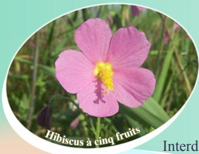
Hibiscus à cinq fruits